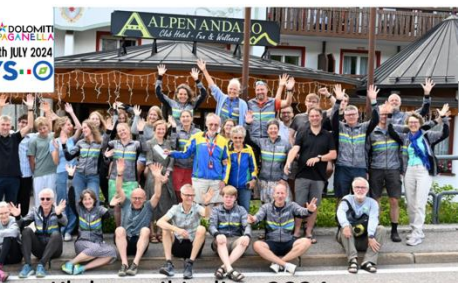
Klubtur til Italien 2024

ine klubkammerater skrev sidste år: http://sollerod-ok.dk/media/3033/komposten-2024-3-