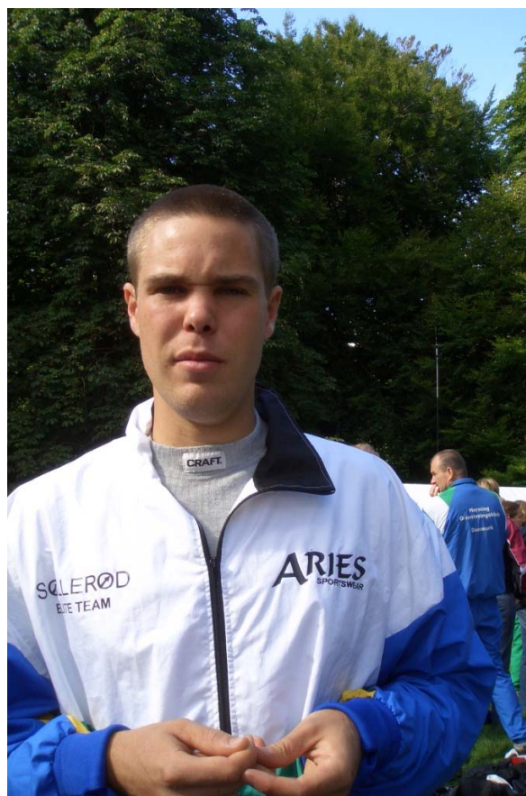
SET-deltagere "fanget ved Midgårdssormen.