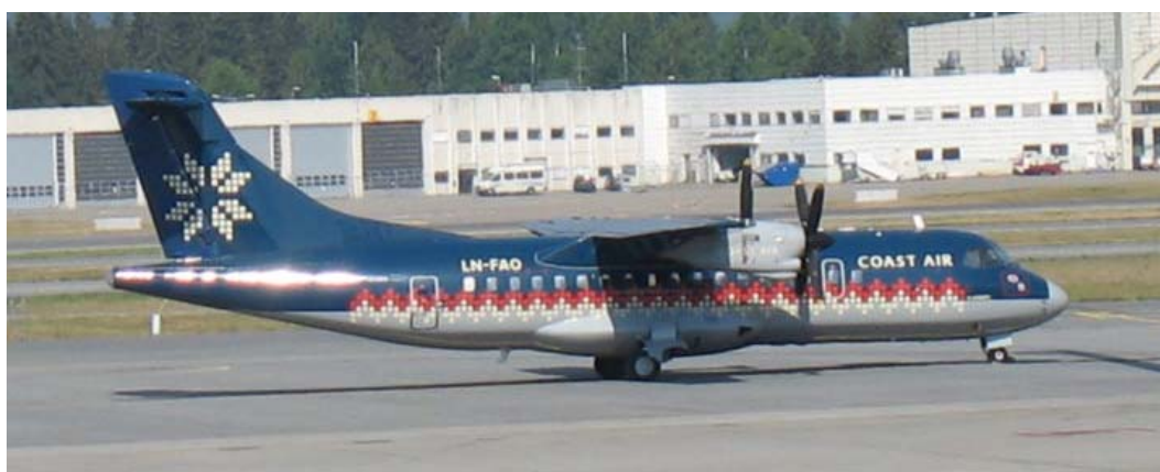
Så flot var Coast Airs fly - den gang selskabet eksisterede.