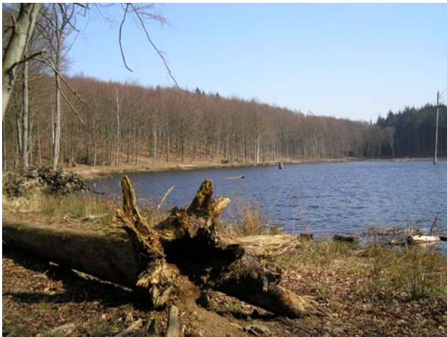
Forårsbillede af Stubbesø (2007)

Herfra løber vandet via en høj brønd videre i rør gennem nordvestdelen af Sækkedam, hvor det forenes med de store vandmængder fra denne lavning. Vandet kommer tydeligst frem i den gamle bæk, som løber til Skovrøddams sydøstkant. Bækken kan i de vådeste perioder minde om en mindre norsk foss, når vandet vælter frem fra det rørsystem, som fører det frem gennem Skårerende, som den smalle passage fra Sækkedam til Skovrøddam hedder.