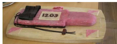
Sport-Ident-enhed, her som lagkage

Her kan løbere også tilmelde sig "manuelt".